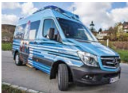
Medizinisch Top-Ausgerüstetes Fahrzeug im Dienste der Palliativpatienten

Für jeden von uns gibt es Orte oder Anlässe, die eine besondere Bedeutung haben oder deren Besuch schon lange auf der persönlichen Wunschliste steht. Doch für manche von uns ist es schwierig, diese Unternehmungen auch in die Tat umzusetzen. Gerade