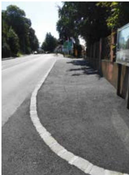
Entsprechend den gültigen Normen adaptierter Geh- und Radweg bei der westlichen Dorfeinfahrt

Ab kommendem Jahr wird dann die Radverbindung durchgehend bis zum Sportplatz. Eines für unsere Gemeinde größten Straßen- und Gehsteigsanierungsprojekte in diesem Jahr wurde nun budgetär und technisch fertiggeplant.