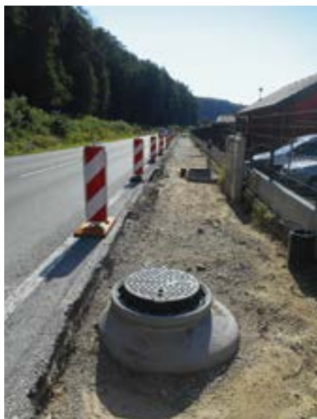
Nach den technischen Einbauten folgt die Asphalttschicht für den Radweg zum Sportplatz

Genau vor der Traffik an der B1 war der Gehweg sehr aufgeraut. Nach einer Anpassung der Gehsteigflucht zur B1 hin wurde die Deckschicht erneuert und ein Begehen ist nun wieder problemlos möglich. Gleichzeitig wurde auch das Gefälle zur Hauptstraße