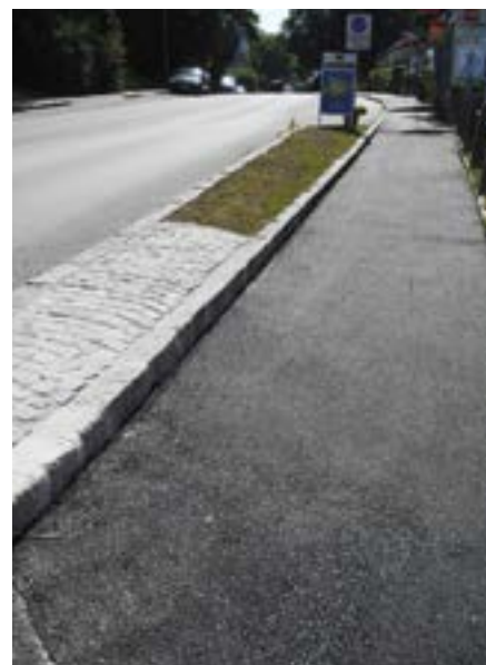
Sanierter und abgeflachter Gehsteigbereich im Bereich Gablitzer Traffik