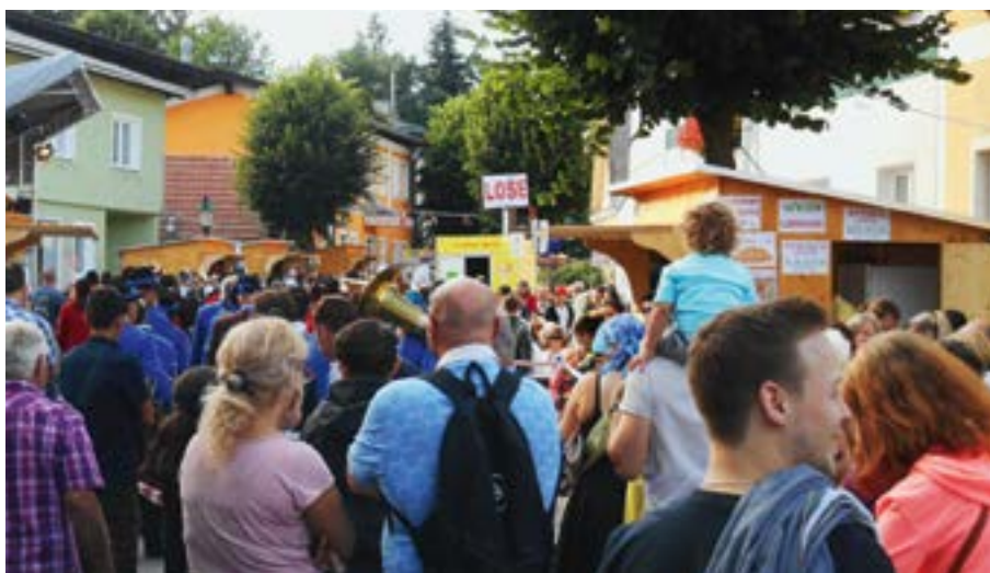
Gute Stimmung am SPÖ-„Team für Gablitz“ Standl mit vielen Freunden und Gästen