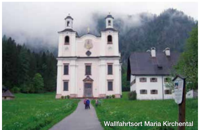
Wallfahrtsort Maria Kirchentäl