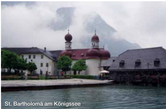
St. Bartholomä am Königssee