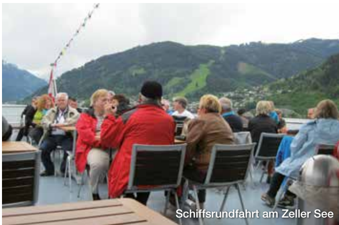
Schiffsrundfahrt am Zeller See